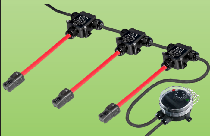
Пример монтажа на 3-х и более кабелях теплофикации в комбинации с соединительными коробками Y25